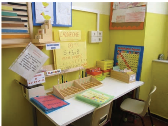
Area laboratorio di matematica