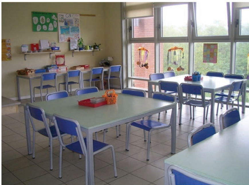
Area tavoli e, sullo sfondo, area laboratori