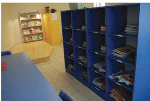
Particolare armadio a giorno