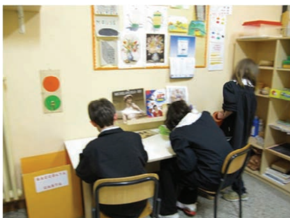
Area laboratorio grafica