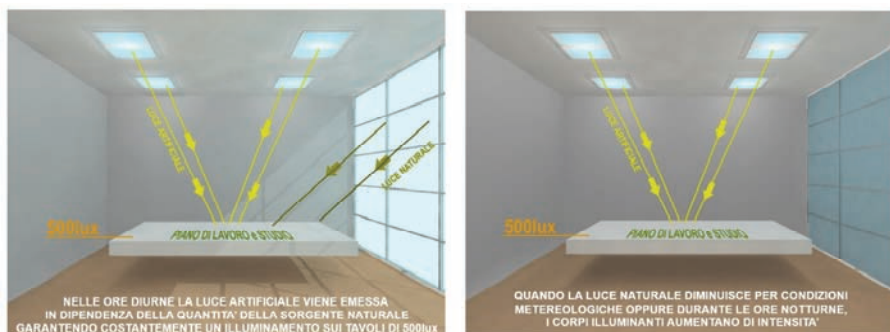
Bilanciamento tra luce naturale e artificiale

Queste soluzioni illuminotecniche consentono di avere un impatto minimo nel passaggio dalla luce naturale a quella artificiale, riducendo l'affaticamento visivo degli alunni e migliorandone anche il livello di attenzione e la capacità di apprendimento.